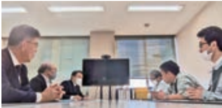
沼津土木御殿場支所にて区役員と協議

西川の護岸嵩上げは年度内に早期対応。県道ガードレール設置は予算確保の上、来年度対応。道路側溝の改善は年度内に堆積土を取り除き、その後の状況を見極めて対応します。