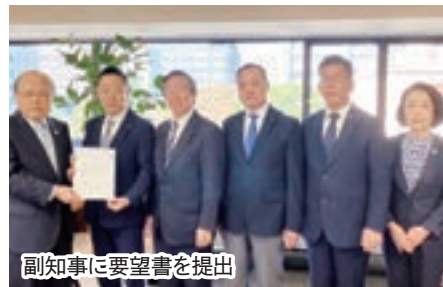
副知事に要望書を提出

物価高、エネルギー価格高騰により農林水産業や中小企業事業所は非常に厳しい経営環境にあるため、国の経済対策閣議決定を受け、県においても速やかに必要予算を確保するよう、要望書を提出し意見交換を行いました。