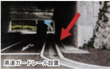
県道ガードレール設置