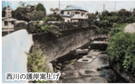
西川の護岸嵩上げ