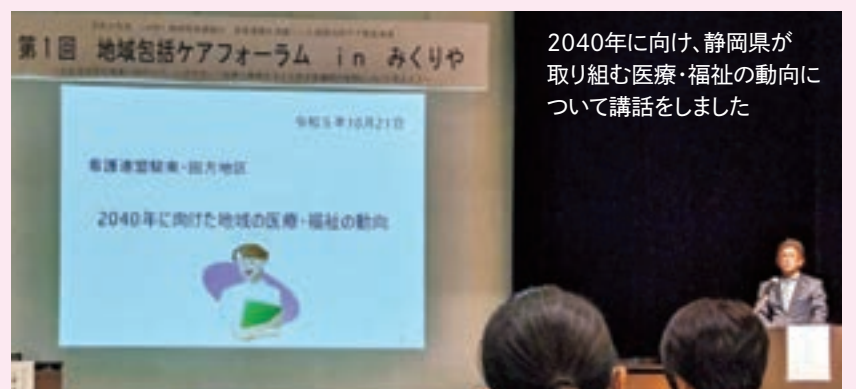
2040年に向け、静岡県が取り組む医療・福祉の動向について講話をしました

こうした状況を踏まえ、私は「地域包括ケアシステムの推進」に向け、県の取り組みを講演させていただきました。参加された看護師の皆さんと共に今後の地域医療の在り方を考える機会を頂きました。